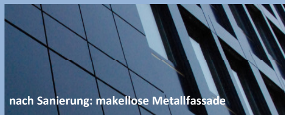
nach Sanierung: makellose Metallfassade

Mit unserer kompetenten Projektbegleitung von A-Z und der einwandfreien Vor-Ort-Neubeschichtung erfüllten wir die hohen Ansprüche des Kunden erfolgreich!