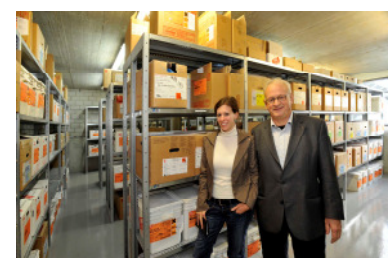
Das Pulverlager: vor und zweieinhalb Jahre nach dem Hochwasser.